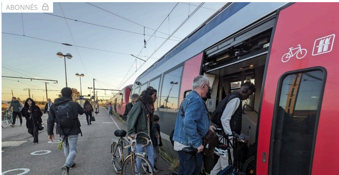
Les TER sur l'axe littoral comme ici à Sète sont souvent saturés.